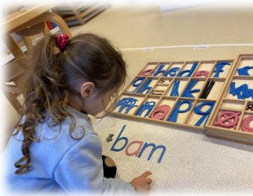
Det bevegelige alfabet