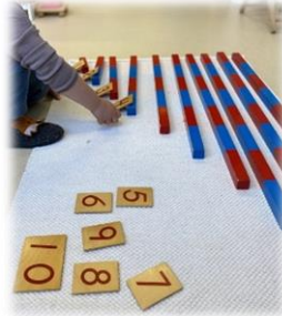
Tellestaver med tallkort